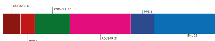
Sièges par groupe politique: 2019-2024 France - Résultats provisoires

La France envoie 79 représentants au Parlement européen. Sur ces 79 députés, 5 députés ne siègeront qu'à compter de la sortie effective du Royaume-Uni de l'Union Européenne.